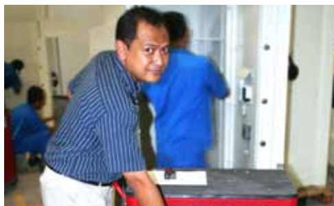
Os trabalhadores da fábrica da Gunnebo em Jacarta participam com regularidade na implementação de melhorias na empresa.