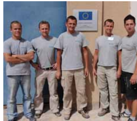
Parte da equipa de técnicos polacos, responsável por instalações em todo o mundo